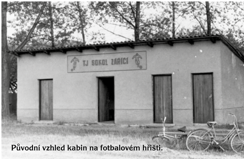
Původní vzhled kabin na fotbalovém hřišti.