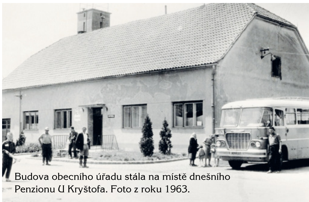
Budova obecního úřadu stála na místě dnešního Penzionu U Kryštofa. Foto z roku 1963.